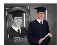
I. Collage de 8x10