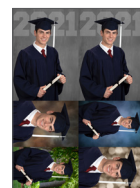
J. Imanes del año de graduación